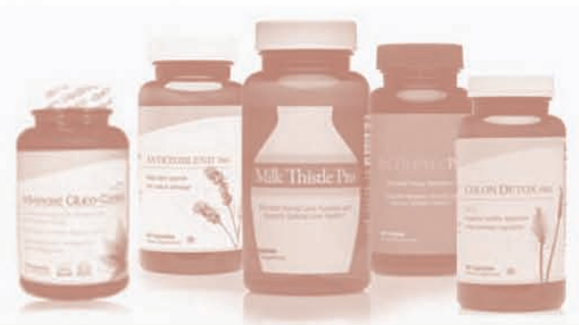
Kuntz E., Kuntz H. Hepatology principles and practice , 2nd Edition, pp864-865, Springer Medizin Verlag Heidelberg 2002, 2006, Germany

Es posible que, en el reino vegetal, existan otras sustancias con agentes específicos que actúen en las estructuras del hígado o contra enfermedades hepáticas y que aún no hayan sido reconocidas como tales.